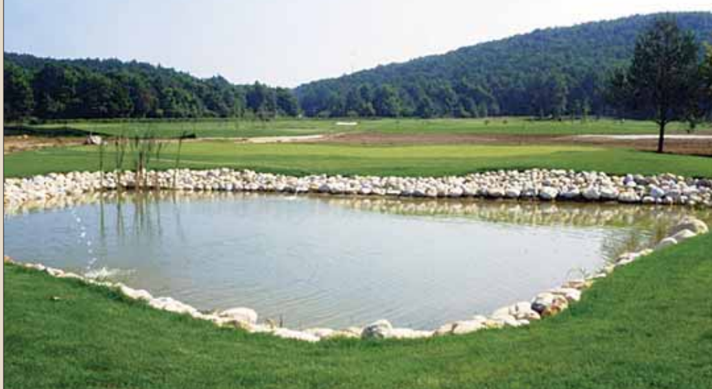
Golf-igralište Dolina kardinala u Mirkopolju

Georgea Tomasa i Toma Simpsona koji su uredili igralište s 18 rupa prilagođeno rekreativcima, ali i vrhunskim igračima. Dugo nakon uređenja isticana je činjenica da je priroda otoka ostala netaknuta. Prema istim projektima izgrađeno je i novo igralište, a zbog toga nije, što je osobito važno, uklonjeno nijedno drvo i ni jedan grm. Od 1945. do devedesetih godina prošlog stoljeća Brijuni su bili rezidencijalno stjecište tadašnjeg jugoslavenskog rukovodstva koje golf nije zanimao. Prema nacrtima iz 1923., igralište s 18 rupa ponovno je uređeno i otvoreno 2006. godine turnirom Brioni Golf Cup Classic.